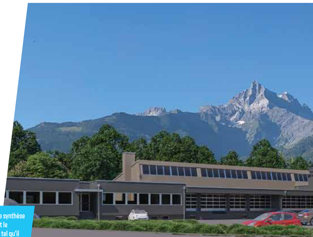
Image de synthèse montrant le bâtiment tel qu'il se présentera à l'issue de la rénovation (Paragon SA).